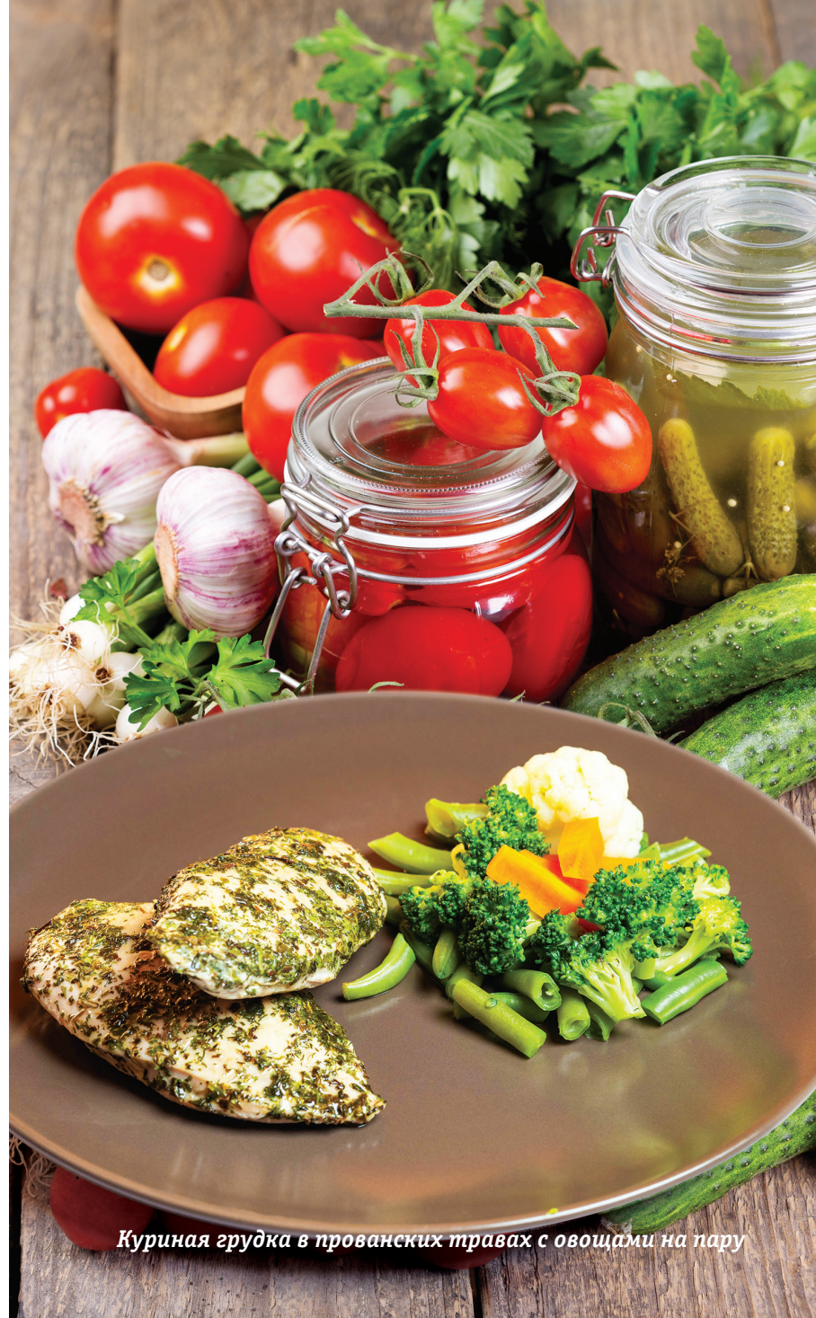
Куриная грудка в прованских травах с овощами на пару