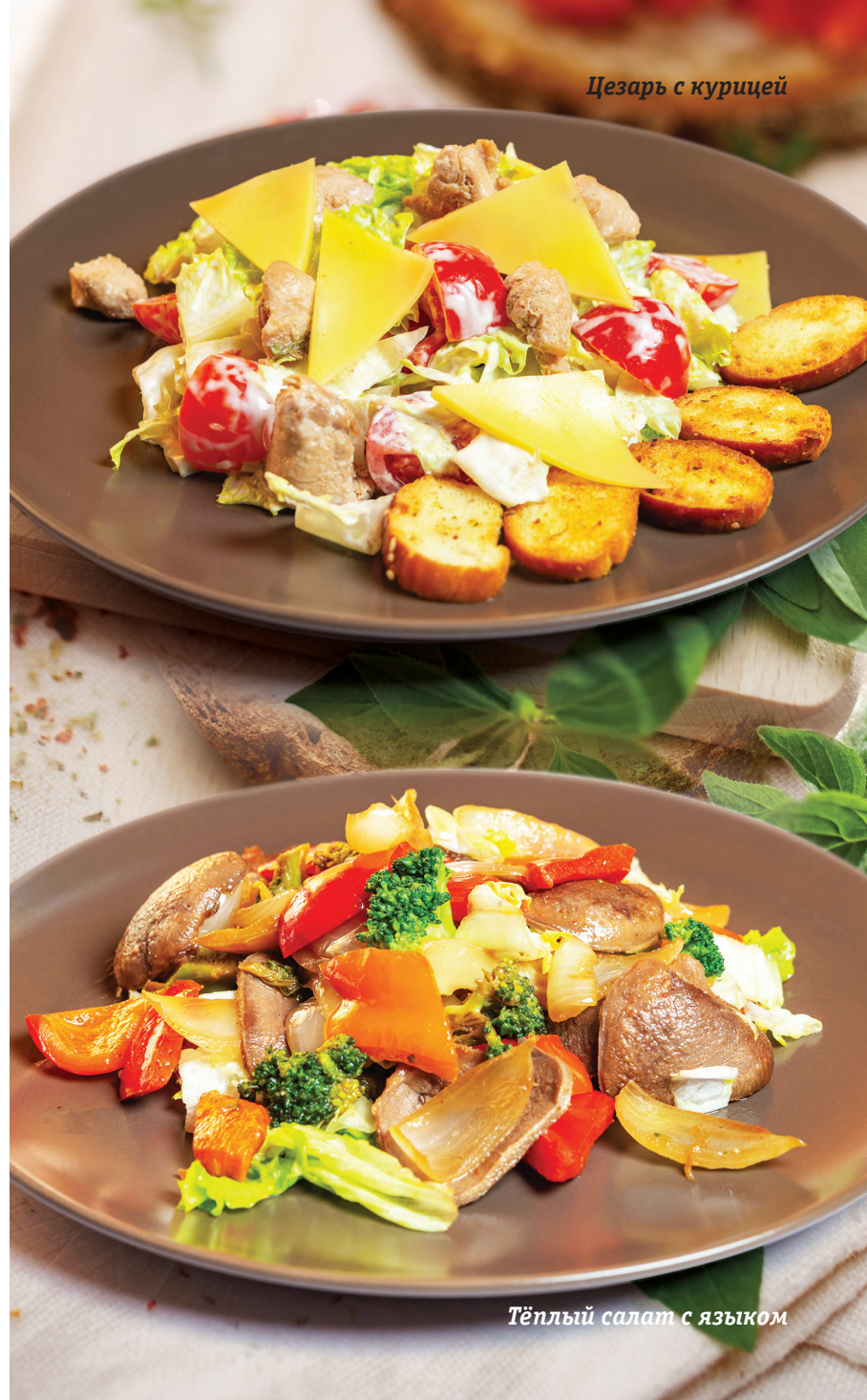
Цезарь с курицей